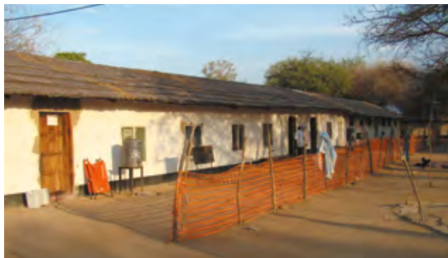
Nemocnica Marialou, Sudán