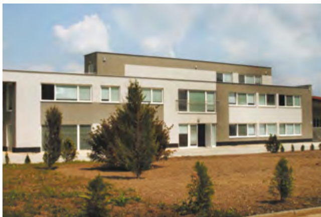
Polianky 6205-4/A Bratislava