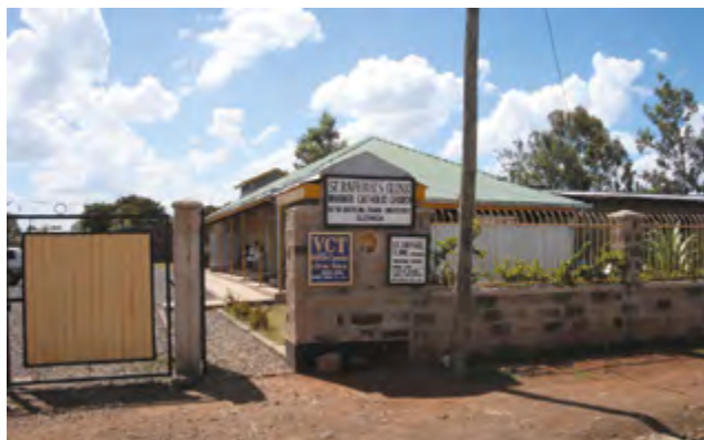
Klinika pre chudobných svätého Rafaela, a svätej Bakithy, Mihango, Keňa