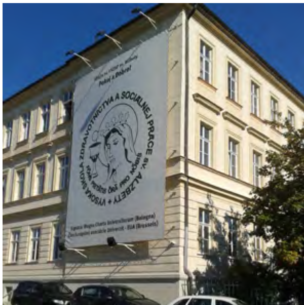
Námestie 1. mája 1 Bratislava