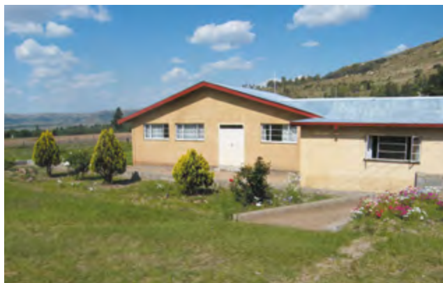
Klinika Maqhaka, Lesotho