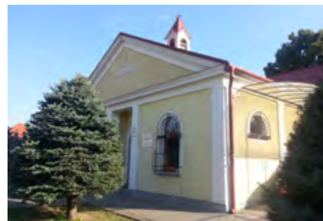
Univerzitné azylové centrum pre rodiny Jozefinum Dolná Krupá 293