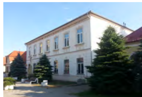
Vzdelávacie a rozvojové stredisko Svätej Matky Terezy, IVSP pri VŠŠA, Dolná Krupá