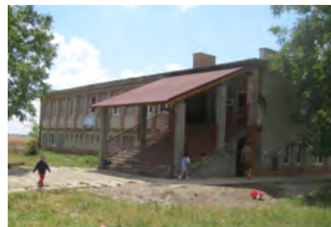
Univerzitné sociálne centrum svätého Don Bosca, Jarná Jarná 322